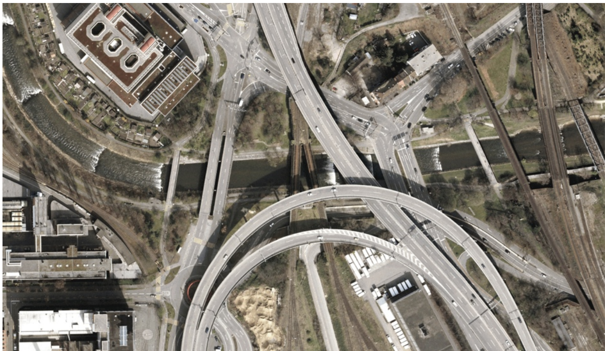
Orthofoto Ausschnitt „RICHARD&HORST“

Nach dieser pionierhaften und zum Teil sehr experimentellen Zwischennutzung folgte Anfang 2004 die mehr auf die benachbarten Quartiere orientierte, sehr breit abgestützte und kooperativ mit Eigentümerin und Kanton entwickelte Zwischennutzung durch die «Vereinigung Interessierter Personen - VIP». Die insgesamt über 75 angeschlossenen Vereine, lokalen Unternehmen und interessierten Einzelpersonen realisierten neue Freiraumangebote wie Infrastruktur für Trendsport, Sonntagsmarkt und Kinderprojekte.