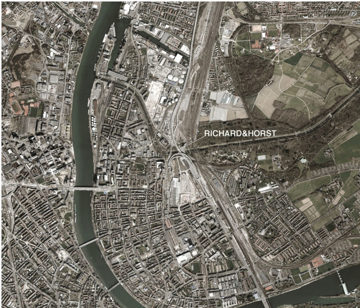
Orthofoto Ausschnitt nt Areal

Unser Ziel ist es, zwei dieser ungenutzten Eisenbahnbrücken „wiederzubeleben“ und kulturell umzunutzen. Geplant ist der Ausbau in den bestehenden statischen Unterbau der Stahlbrücken. In diese Kuben wird den Bewohnern der Erlenmatt, des Kleinbasels und weit darüber hinaus ein gastronomisches und kulturelles Erlebnis in einer schweizweit und vielleicht sogar international einzigartigen Lokalität angeboten. Eine solche Konstruktion ist nach Vorabklärungen mit einem Statiker grundsätzlich möglich, ohne dass dafür weitgehende Veränderungen an der Brückenarchitektur nötig wären. Diese soll soweit wie möglich in ihrem Originalzustand belassen werden. Der Ort soll nicht «umgestaltet», sondern viel mehr den Menschen zugänglich gemacht werden und ein historisches Kulturgut auf eine lebendige Art erhalten bleiben.